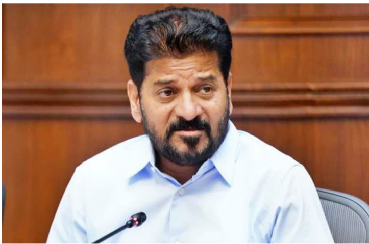
హైదరాబాద్ : నిర్ణయాలను రేవంత్ రెడ్డి మీడియాకు వెల్లడించారు. తెలంగాణ రాష్ట్ర ప్రభుత్వం తీసుకున్న నిర్ణయం వల్ల 1.11 కోట్ల మంది కార్మికులకు మేలు జరుగుతుందని ఆయన వెల్లడించారు.