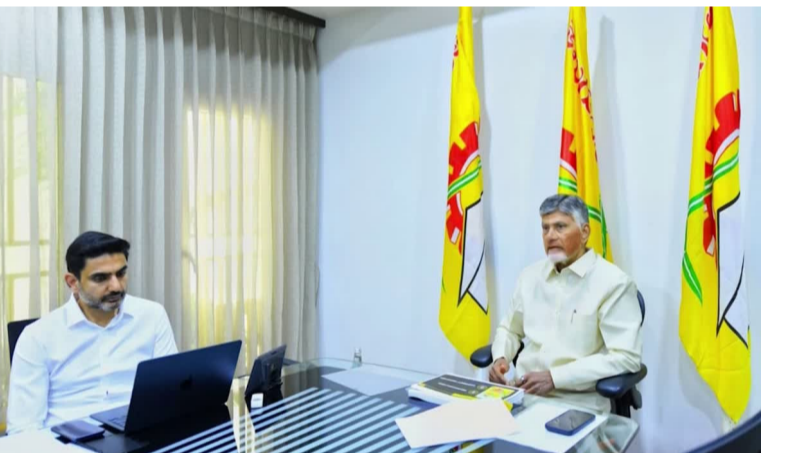
అమరావతి : తెలుగుదేశం మహానాడును ఈసారి "స్త్రీ శక్తి" ఢిమ్తో నిర్వహించాలని పార్టీ అధినేత కేసీఆర్ ఆదేశించారు. ఈసారి "స్త్రీ శక్తి" ప్రధాన ఢిమ్గా చంద్రబాబు నిర్వహించారు. సంప్రదాయ ఓటమి బ్యాంకును కాపాడుకుంటూ, పార్టీ వెన్నుదండైన నాటి బీసీలకు భరోసా ఇచ్చేలా మహానాడును విజయవంతం చేయాలని పిలుపునిచ్చారు. కార్యకర్తే అధినేత అనేది ప్రతిబింబించేలా శ్రేణులందరినీ భాగస్వాములను చేస్తూ, సరికొత్త ఉత్సాహంతో ఈ వేడుకను వండుగలా నిర్వహిద్దామని పిలుపునిచ్చారు. ఆంధ్రప్రదేశ్ ముఖ్యమంత్రి, తెలుగుదేశం అధినేత చంద్రబాబు అధ్యక్షతన జరిగిన పాలిట్ బ్యూరో సమావేశంలో "మహానాడు-2026" నిర్వహణ ప్రధాన ఆజెండాగా కీలక నిర్ణయాలు తీసుకున్నారు. ఈసారి "స్త్రీ శక్తి" ప్రధాన ఢిమ్గా చంద్రబాబు నిర్వహించాలని పాలిట్ బ్యూరో నిర్ణయించింది. పార్టీ ఆవిర్భావం నాటి బీసీలకు భరోసా ఇచ్చేలా మహానాడును విజయవంతం చేయాలని పిలుపునిచ్చారు. కార్యకర్తే అధినేత అనేది ప్రతిబింబించేలా శ్రేణులందరినీ భాగస్వాములను చేస్తూ, సరికొత్త ఉత్సాహంతో ఈ వేడుకను వండుగలా నిర్వహిద్దామని పిలుపునిచ్చారు. ఆంధ్రప్రదేశ్ ముఖ్యమంత్రి, తెలుగుదేశం అధినేత చంద్రబాబు అధ్యక్షతన జరిగిన పాలిట్ బ్యూరో సమావేశంలో "మహానాడు-2026" నిర్వహణ ప్రధాన ఆజెండాగా కీలక నిర్ణయాలు తీసుకున్నారు. ఈసారి "స్త్రీ శక్తి" ప్రధాన ఢిమ్గా చంద్రబాబు నిర్వహించాలని పాలిట్ బ్యూరో నిర్ణయించింది. పార్టీ ఆవిర్భావం నాటి బీసీలకు భరోసా ఇచ్చేలా మహానాడును విజయవంతం చేయాలని పిలుపునిచ్చారు.